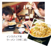
インスタバイア系 ラーメン「小杉二郎」

県立大アクセス... JR小杉駅南口から、徒歩約20分(約2km) または、射水市コミュニティバス「14.小杉・太閤山線」乗車約5分